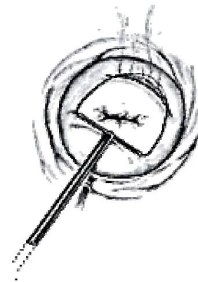
Konisatsiooni teostatakse elekterlinguga

Nagu kõikide kirurgiliste operatsioonide puhul, võib ka emakakaela konisatsiooniga kaasneda tüsistusi. Üks võimalikest tüsistustest on verejooks vahetult pärast operatsiooni või hilisemas perioodis (1 – 2 nädalat peale operatsiooni). Tekkinud verejooks võib vajada korduvat õmblemist või koaguleerimist (kõrvetamist). Kui eemaldatud koetükk oli suur, võib konisatsioonijärgselt tekkida emakakaela puudulikkus. Emakakaela puudulikkuse korral on oluliselt suurem risk raseduse katkemiseks ja enneaegseks sünnituseks. Emakakaela puudulikkust saab raseduse ajal korrigeerida emakakaelale tugevdava õmbluse asetamisega. Üldjuhul kulgeb rasedus selle protseduuri järgselt normaalselt. Elektrilingu kasutades võib tekkida naha kahjustus (arm) elektroodi piirkonda. Harva esinev tüsistus on allergiline reaktsioon narkoosi ravimitele.